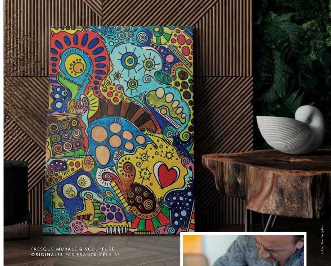
FRESQUE MURALE & SCULPTURE ORIGINALES PAR FRANCK CÉLAIRE