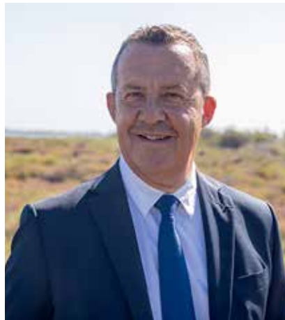
Stéphane ROSSIGNOL Président de l'Agglomération du Pays de l'Or, conseiller régional, maire de La Grande Motte

L'Agglomération du Pays de l'Or peut s'enorgueillir d'un tissu économique dense qui s'est bâti au fil des ans autour d'activités emblématiques telles que le tourisme, le nautisme, l'agriculture et l'aéronautisme. Avec près de 7000 entreprises sur son territoire, elle est la 2 e agglomération de la zone d'emploi de Montpellier. À travers ses 14 zones d'activités, réparties sur les 8 communes de son territoire, et les aides à l'immobilier qu'elle propose, elle contribue à l'installation de nouvelles entreprises dont certaines sont leaders dans leur domaine d'activité. C'est notamment le cas de Zimmer Biomet et de MG Développement qui ont choisi de s'implanter au sein du Parc Industries Or Méditerranée (PIOM). Le PIOM est un parc d'activité de dernière génération bénéficiant d'un environnement paysager qualitatif et