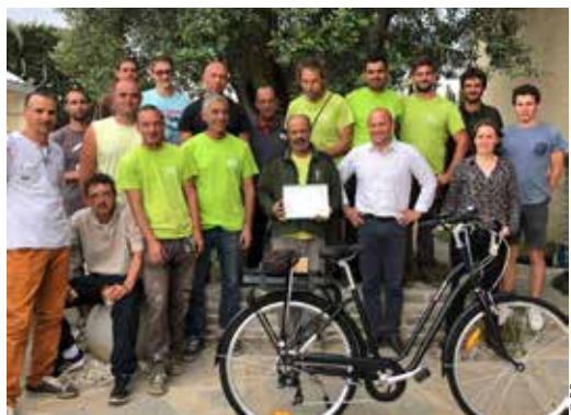
L'équipe de Sarivière au complet

œuvres d'art. Entre 2020 et 2022, elle enregistre une croissance de 28 % de son chiffre d'affaires, avec un atterrissage à 4,2 M€ (95 % pour l'activité de paysagiste et 5 % pour la pépinière). Sarivière obtient en août 2023 la médaille d'argent du label EcoVadis pour ses engagements RSE. ■