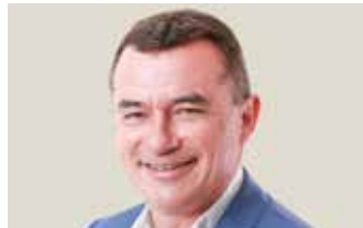
Gilles D'ETTOIRE - Maire d'Agde,

Maire de Sète, président de Sète Agglopôle Méditerranée