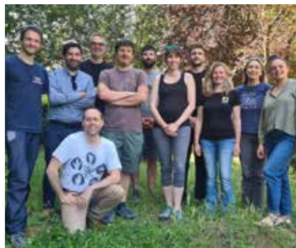
L'équipe d'Agroof au complet

son chiffre d'affaires entre 2021 et 2022. Elle a également développé un programme de parrainage d'arbres, baptisé 20 000 Pieds sur Terre, pour soutenir des projets agroforestiers. 55 entreprises ont déjà cofinancé 10 500 plants d'arbres au profit d'agriculteurs du territoire, et 79 jours de recherche. ■