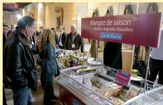
Show-room Sud de France pour les magasins Système U, organisé par Sud de France export le 21 avril dernier.

Pour beaucoup d'entreprises adhérentes, la marque